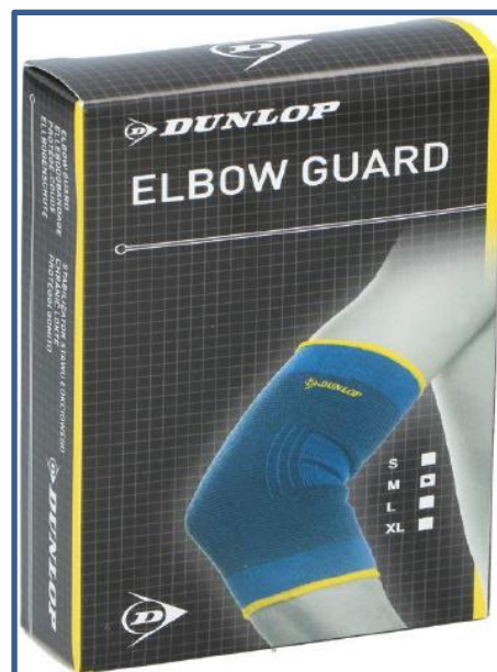
Photo de l'article Picture of the item

L'objet de la déclaration décrit ci-dessus est conforme à la législation d'harmonisation de l'Union applicable: The described object of the declaration is in conformity with the relevant Union harmonisation legislation: