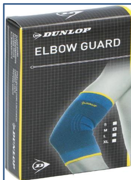
Foto des Artikels Picture of the item

Der Artikel wie beschrieben ist konform mit den einschlägigen Harmonisierungsrechtsvorschriften der Union: The described object of the declaration is in conformity with the relevant Union harmonisation legislation: