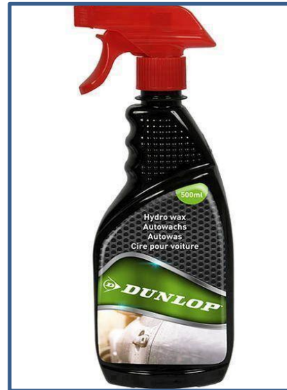
Foto des Artikels Picture of the item

Der Artikel wie beschrieben ist konform mit den einschlägigen Harmonisierungsrechtsvorschriften der Union: The described object of the declaration is in conformity with the relevant Union harmonisation legislation: