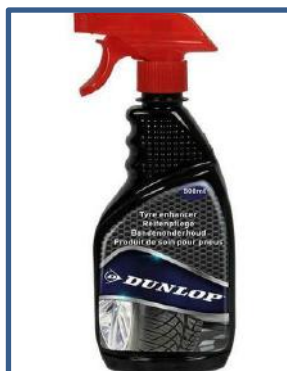
Photo de l'article Picture of the item

L'objet de la déclaration décrit ci-dessus est conforme à la législation d'harmonisation de l'Union applicable: