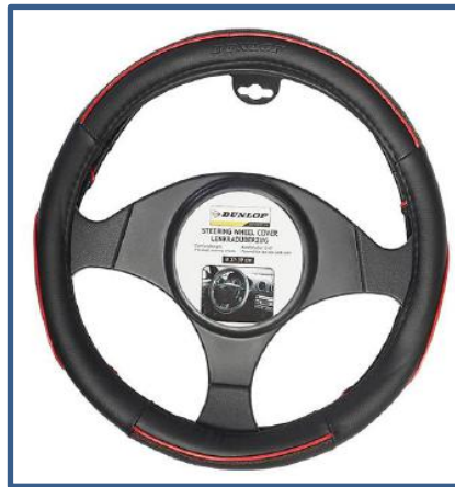
Foto des Artikels Picture of the item

Der Artikel wie beschrieben ist konform mit den einschlägigen Harmonisierungsrechtsvorschriften der Union: