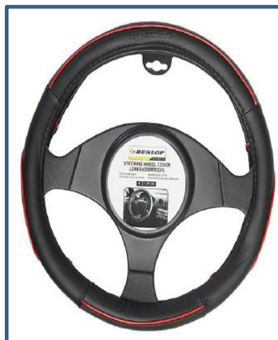
Foto van het artikel Picture of the item

Het beschreven voorwerp is in overeenkomst met de desbetreffende harmonisatiewetgeving van de Unie: