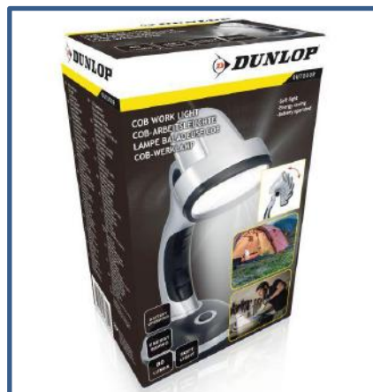
Foto van het artikel Picture of the item

Het beschreven voorwerp is in overeenkomst met de desbetreffende harmonisatiewetgeving van de Unie: