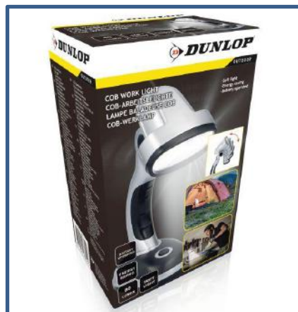
Photo de l'article Picture of the item

L'objet de la déclaration décrit ci-dessus est conforme à la législation d'harmonisation de l'Union applicable: