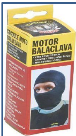
Foto des Artikels Picture of the item

Der Artikel wie beschrieben ist konform mit den einschlägigen Harmonisierungsrechtsvorschriften der Union: