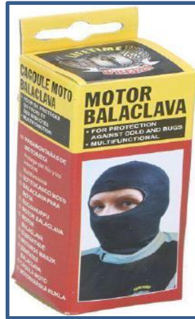
Foto van het artikel Picture of the item

Het beschreven voorwerp is in overeenkomst met de desbetreffende harmonisatiewetgeving van de Unie: