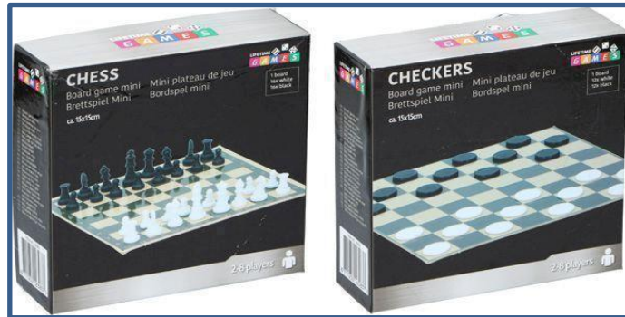
Foto des Artikels Picture of the item

Der Artikel wie beschrieben ist konform mit den einschlägigen Harmonisierungsrechtsvorschriften der Union: