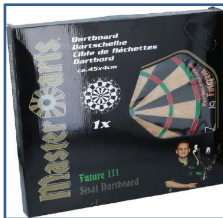
Foto des Artikels Picture of the item

Der Artikel wie beschrieben ist konform mit den einschlägigen Harmonisierungsrechtsvorschriften der Union: