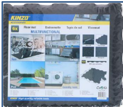
Foto des Artikels Picture of the item

Der Artikel wie beschrieben ist konform mit den einschlägigen Harmonisierungsrechtsvorschriften der Union: