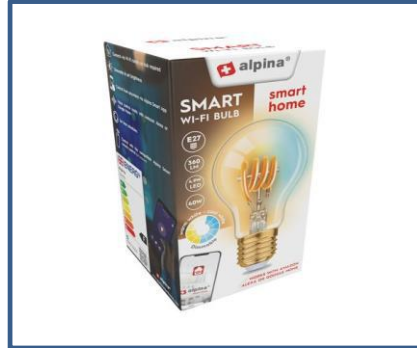
Foto van het artikel Picture of the item

Het beschreven voorwerp is in overeenkomst met de desbetreffende harmonisatiewetgeving van de Unie: