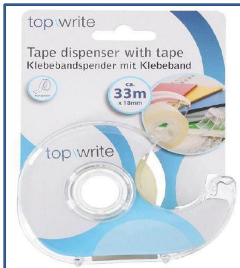
Foto des Artikels Picture of the item

Der Artikel wie beschrieben ist konform mit den einschlägigen Harmonisierungsrechtsvorschriften der Union: