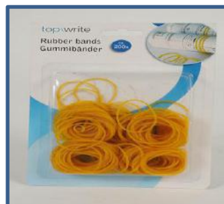
Photo de l'article Picture of the item

L'objet de la déclaration décrit ci-dessus est conforme à la législation d'harmonisation de l'Union applicable: