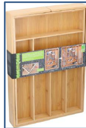
Foto des Artikels Picture of the item

Der Artikel wie beschrieben ist konform mit den einschlägigen Harmonisierungsrechtsvorschriften der Union: