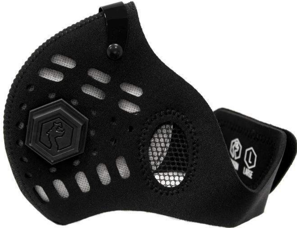
Maska Sport II