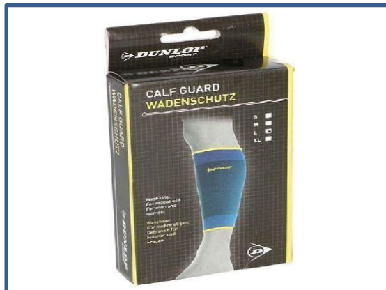
Photo de l'article Picture of the item

L'objet de la déclaration décrit ci-dessus est conforme à la législation d'harmonisation de l'Union applicable: The described object of the declaration is in conformity with the relevant Union harmonisation legislation: