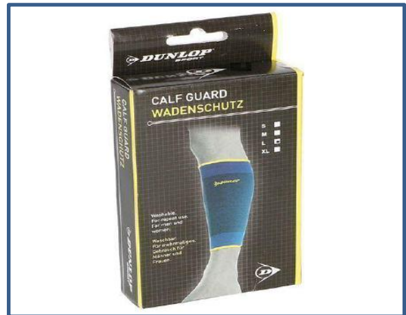
Foto des Artikels Picture of the item

Der Artikel wie beschrieben ist konform mit den einschlägigen Harmonisierungsrechtsvorschriften der Union: The described object of the declaration is in conformity with the relevant Union harmonisation legislation: