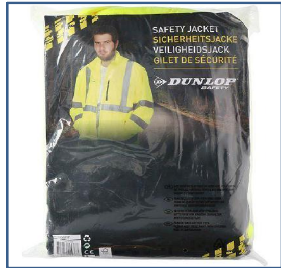
Foto des Artikels Picture of the item

Der Artikel wie beschrieben ist konform mit den einschlägigen Harmonisierungsrechtsvorschriften der Union: The described object of the declaration is in conformity with the relevant Union harmonisation legislation: