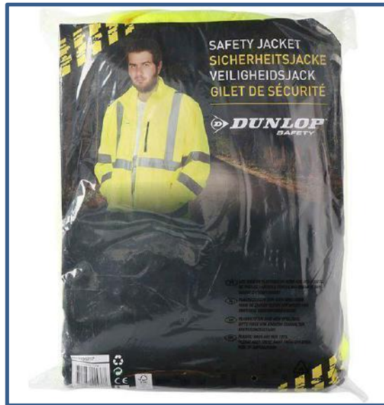
Foto van het artikel Picture of the item

Het beschreven voorwerp is in overeenkomst met de desbetreffende harmonisatiewetgeving van de Unie: The described object of the declaration is in conformity with the relevant Union harmonisation legislation: