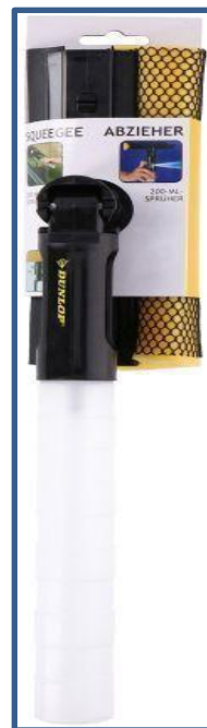
Photo de l'article Picture of the item

L'objet de la déclaration décrit ci-dessus est conforme à la législation d'harmonisation de l'Union applicable: The described object of the declaration is in conformity with the relevant Union harmonisation legislation: