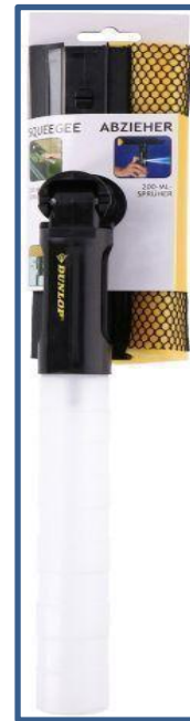
Foto des Artikels Picture of the item

Der Artikel wie beschrieben ist konform mit den einschlägigen Harmonisierungsrechtsvorschriften der Union: The described object of the declaration is in conformity with the relevant Union harmonisation legislation: