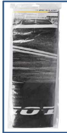
Foto des Artikels Picture of the item

Der Artikel wie beschrieben ist konform mit den einschlägigen Harmonisierungsrechtsvorschriften der Union: