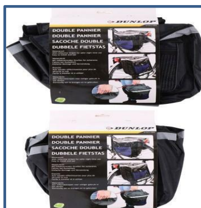
Foto van het artikel Picture of the item

Het beschreven voorwerp is in overeenkomst met de desbetreffende harmonisatiewetgeving van de Unie: