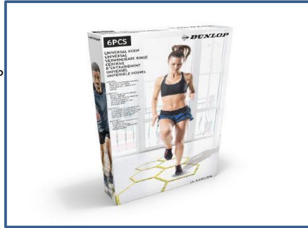
Photo de l'article Picture of the item

L'objet de la déclaration décrit ci-dessus est conforme à la législation d'harmonisation de l'Union applicable: The described object of the declaration is in conformity with the relevant Union harmonisation legislation: